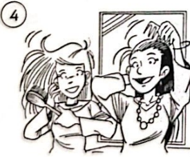
Elles se coiffent.