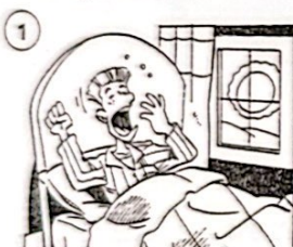
Il se lève.