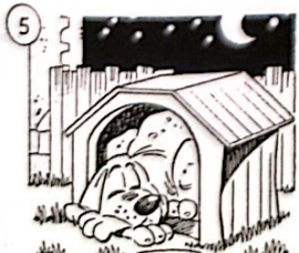
Il se couche.