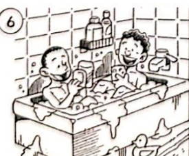
Ils se lavent.

C'est quel jour aujourd'hui et _____ heure est-il ? _____ dimanche ! Il est onze heures ! Super ! Je _____ mes copains et nous _____ au restaurant. Après, nous _____ à la piscine et nous _____. Ensuite, nous _____. Et le soir, je _____ un film ! _____ le dimanche !