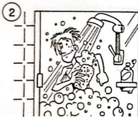
Il se douche.