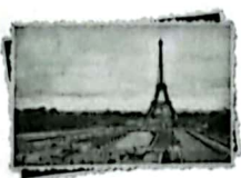
la carte postale