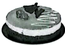
le gâteau d'anniversaire